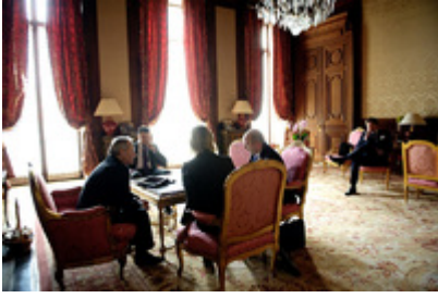
Wywiad dla TTU