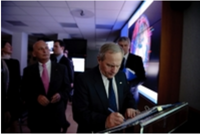
Zwiedzenie Dowództwa Obrony Powietrznej i Operacji Powietrznych Francji