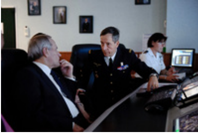
Zwiedzenie Dowództwa Obrony Powietrznej i Operacji Powietrznych Francji