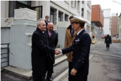
Zwiedzenie Dowództwa Obrony Powietrznej i Operacji Powietrznych Francji