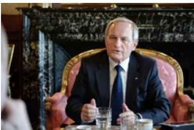
Wywiad dla TTU