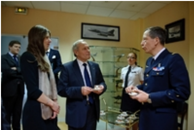
Zwiedzenie Dowództwa Obrony Powietrznej i Operacji Powietrznych Francji