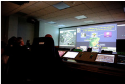
Zwiedzenie Dowództwa Obrony Powietrznej i Operacji Powietrznych Francji