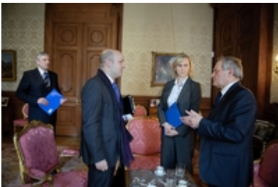
Wywiad dla TTU