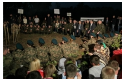
fot. AON #7