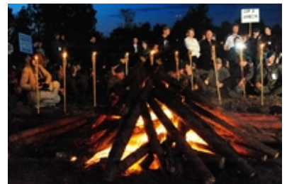
fot. AON #8