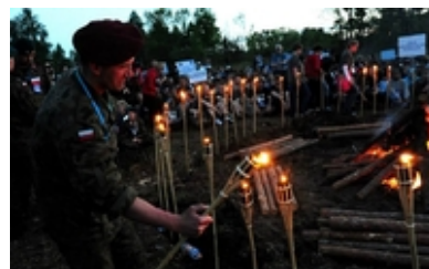
fot. AON #10