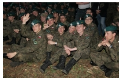
fot. AON #12