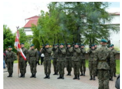
fot. Roman Adamczyk #3