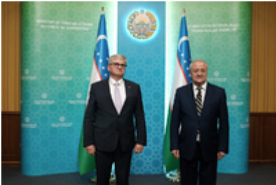
Spotkanie z ministrem spraw zagranicznych Uzbekistanu Abdulazizem Kamilovem