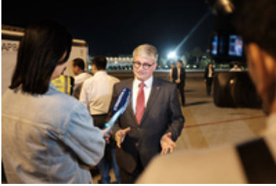
Przekazanie szczepionek przeciwko COVID-19