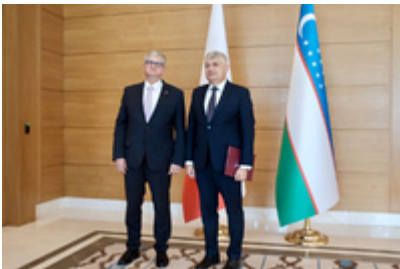
Spotkanie z Sekretarzem Rady Bezpieczeństwa Uzbekistanu Wiktorem Machmudowem