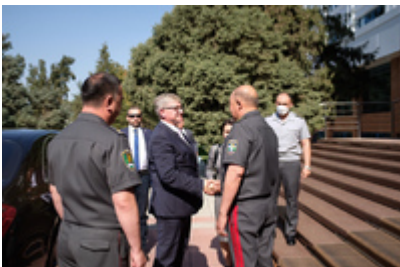
Spotkanie z ministrem obrony Uzbekistanu gen. dyw. Bakhodirem Kurbanowem