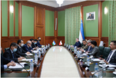
Spotkanie z ministrem spraw zagranicznych Uzbekistanu Abdulazizem Kamilovem