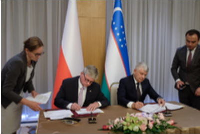
Spotkanie z Sekretarzem Rady Bezpieczeństwa Uzbekistanu Wiktorem Machmudowem