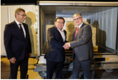
Przekazanie szczepionek przeciwko COVID-19