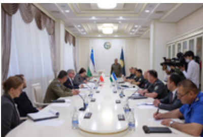
Spotkanie z ministrem obrony Uzbekistanu gen. dyw. Bakhodirem Kurbanowem